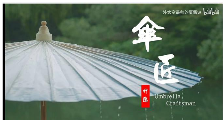
图 7 双语纪录片——伞匠

让学生们了解到这些深藏于民间的、关于民族古老的生命记忆和活态的文化遗产。拓展延伸思考，在学习通上以小组抢答的方式来完成。